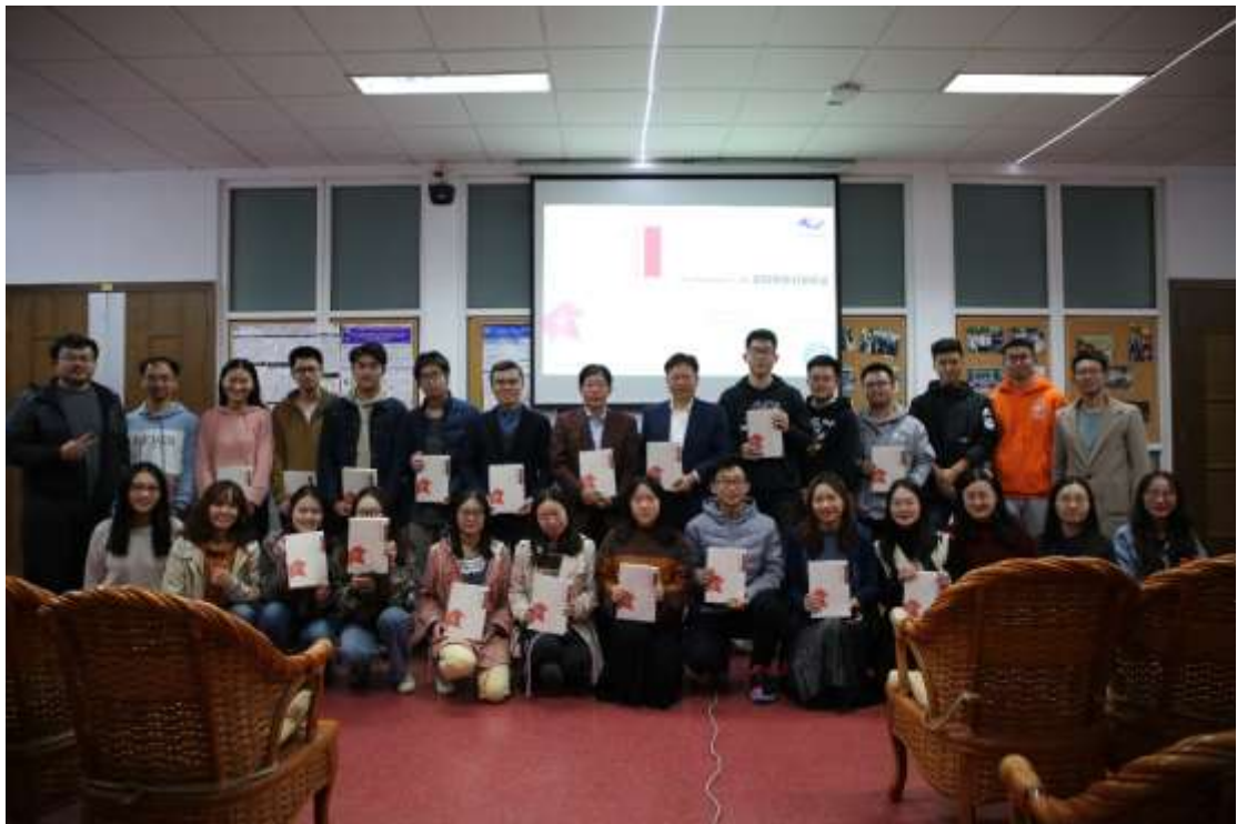
图 8 老师与获得赠书同学合影

在新书发布会的末尾，主持人抽取了 20 位幸运儿获赠《我的科研故事·第四卷》一本，并合影留念。最后，新书发布会在愉快的气氛中结束。