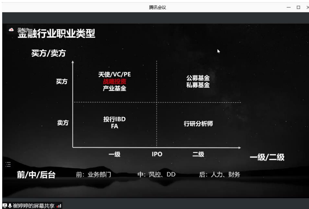
图3 金融行业职业类型

买方和卖方中，买方的目标是购买公司，卖方则是卖公司，将其作为典型业务单元的 FA 和投行把公司卖上市，使其受二级市场认可，然后从中获取回报。