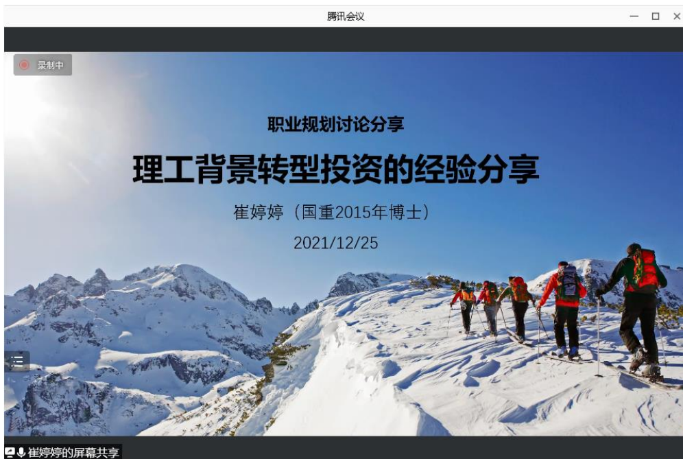
图 1 崔婷婷作精彩分享