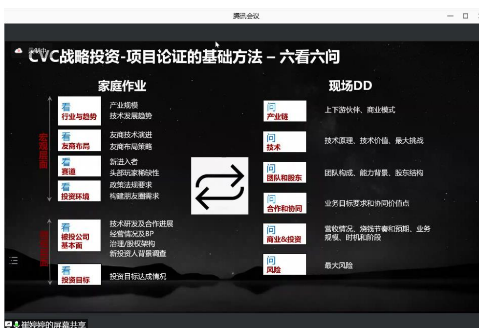
图 4 “六看六问”的项目论证方法

以华为为例，崔婷婷简单介绍了战略投资工作的相关内容。首先是投资逻辑，华为三大主流投资逻辑为连续性逻辑、先进性逻辑和生态逻辑。2019 年受到芯片封锁等困难的影响后，为保证其业务的连续性，华为开始做相关投资，为连续性逻辑。华为一直在聚焦未来 5~10 年新的技术方向，会对自身能力不具备但非常重要的技术方向做先进性投资，使其成为华为未来产业链中的一部分，为先进性逻辑。生态逻辑则是在产业链上比较关键的节点上连接了非常多的合作伙伴，通过相应的投资和牵引，持续构建华为的生态，增加终端竞争力。